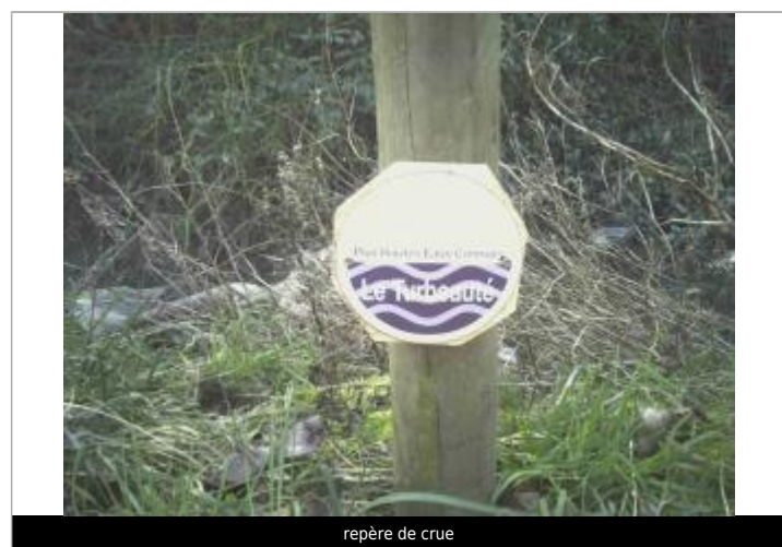
repère de crue