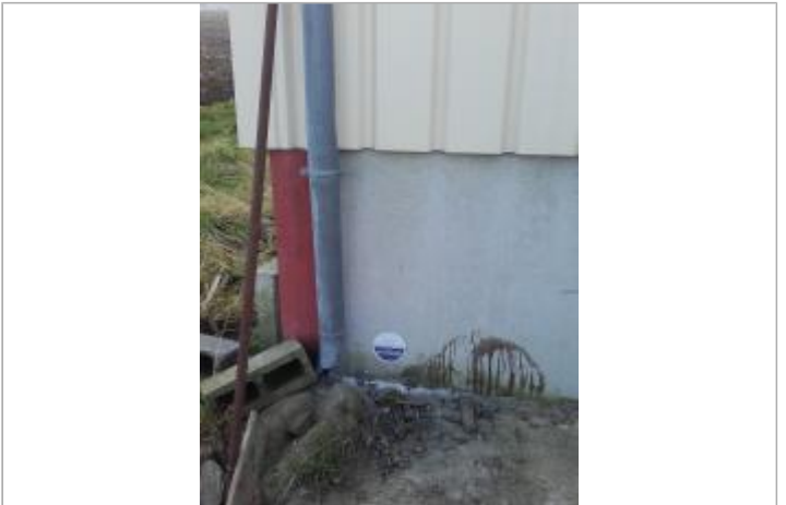
Site du repère

GÉOLOCALISATION --- Coordonnées WGS84 : X: 2.62959050 / Y: 50.55633560 Coordonnées RGF93 (Lambert 93) X: 673709.18 / Y: 7051078.01 Coordonnées RGF93 (ETRS89) : X: 2.6295905 / Y: 50.5563356