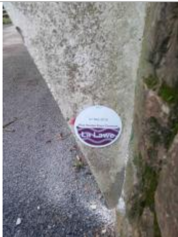
repère crue 31-05-2016