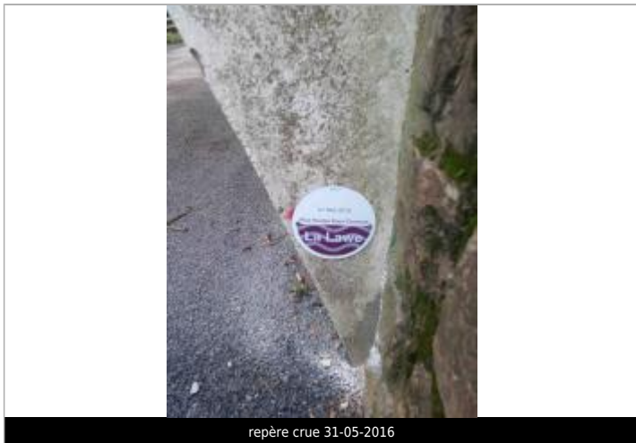
repère crue 31-05-2016