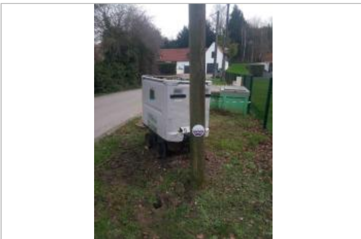
site du repère

GÉNÉRAL Unité de gestion : Bassins du Nord Code : 2018-14 Date de mise à jour : 18/04/2018 Auteur : SYMSAGEL