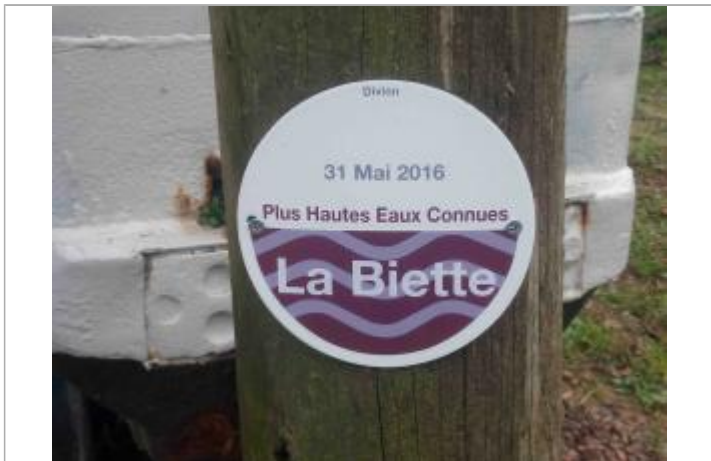
repère crue 31-05-2016

MARQUE Maximum de l'inondation : Oui Visibilité : Oui État du repère : Bon Pérennité : Longue Repère calculé : Non PHEC : Oui