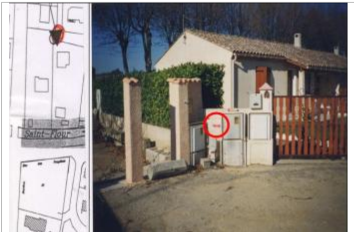
Muret à gauche de l'entrée près des coffrets EDF

GÉOLOCALISATION Coordonnées WGS84 : X: 2.36171990 / Y: 43.18405000 Coordonnées RGF93 (Lambert 93) X: 648073.5 / Y: 6231856.87 Coordonnées RGF93 (ETRS89) : X: 2.3617199 / Y: 43.18405