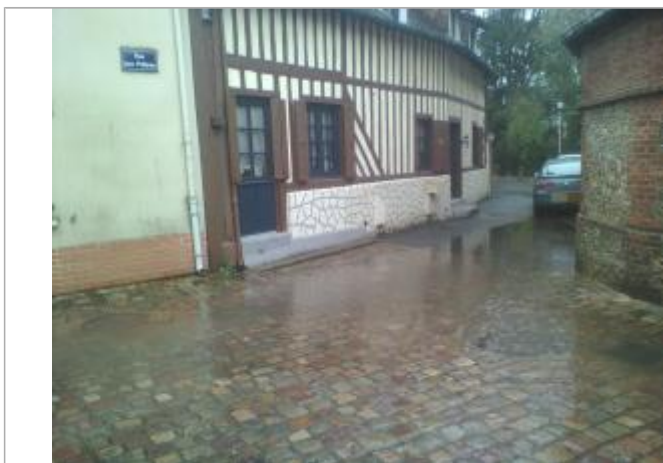
Niveau d'eau a atteint la deuxième pierre du secteur pavé devant le seuil de la porte

Altitude calculée de l'eau (en m) : 9.725