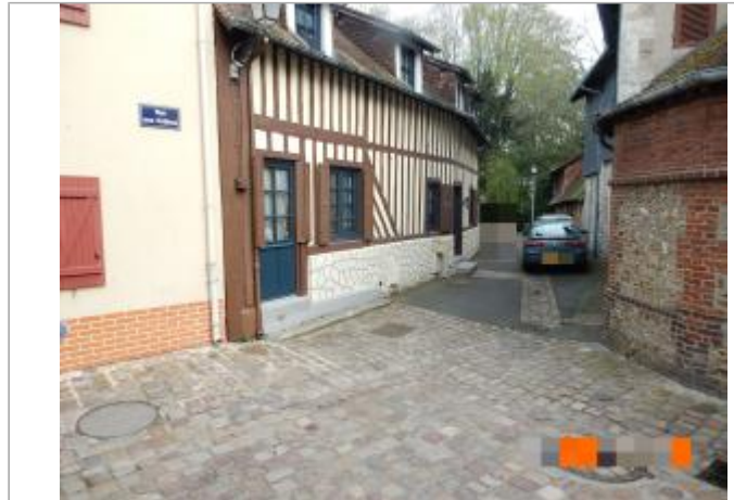
Croisement de la rue aux Prêtres et de la rue Vieille

Coordonnées WGS84 : X: 0.18100102 / Y: 49.28492100