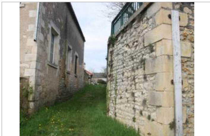
Ecole du Sacré-Coeur - vue vers village