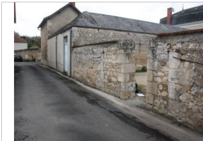
Site rue du Crémault (1)

Coordonnées WGS84 : X: 0.57205936 / Y: 46.68187500 Coordonnées RGF93 (Lambert 93) X: 514452.14 / Y: 6623051.42 Coordonnées RGF93 (ETRS89) : X: 0.5720594 / Y: 46.681875 Code Hydro : L---0060 Rive de référence : Gauche