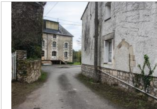
Maison du 6 rue du moulin