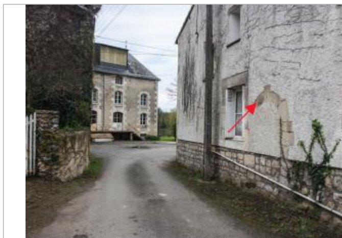
Marque 1896 (1)