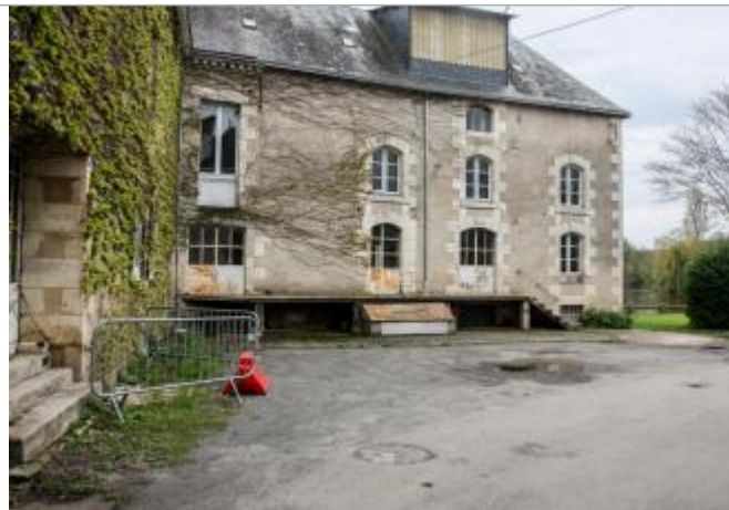
Site du moulin Barreau