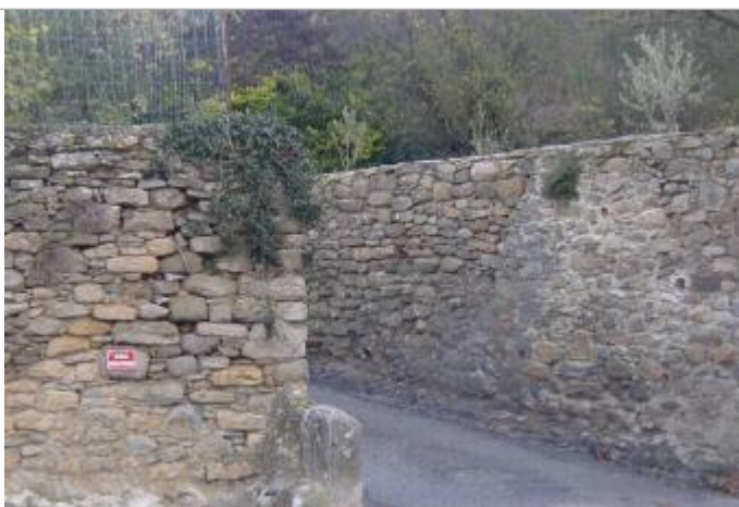
Mur de clôture

Altitude calculée de l'eau (en m) : 161.7