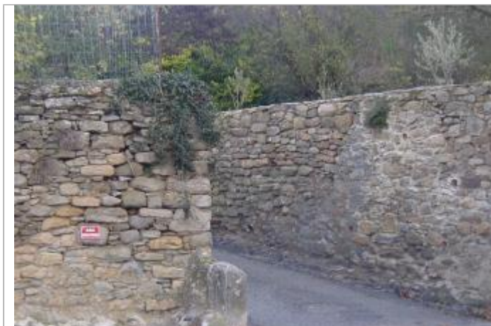
Mur de clôture