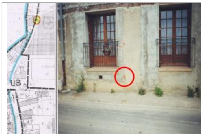
Façade de maison

Altitude calculée de l'eau (en m) : 23.6 m