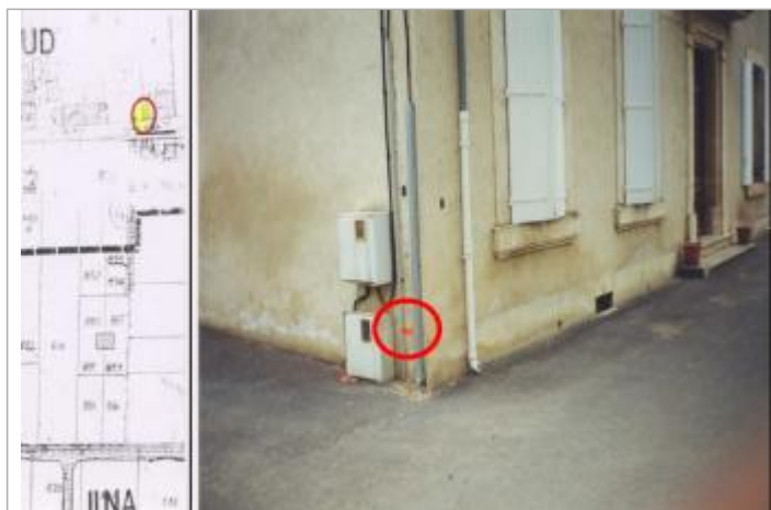
angle façade maison

Altitude calculée de l'eau (en m) : 23.55