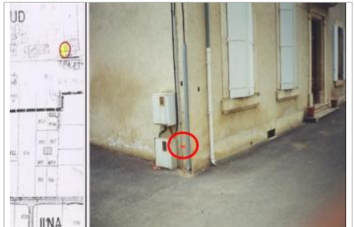
Angle façade de maison

Coordonnées WGS84 : X: 2.85225070 / Y: 43.22918900