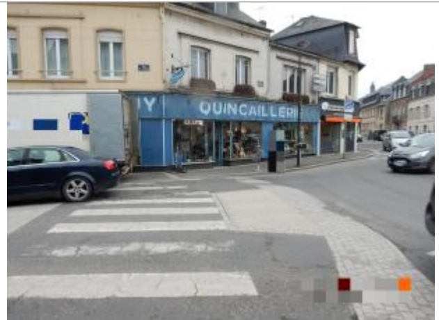
Quincaillerie, 1 place Sainte Mélaine