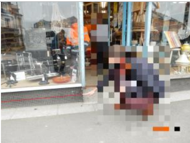
Entre 5 et 10 cm au-dessus du seuil au niveau du trait rouge

Organisme : SPC Seine aval - Côti ers normands