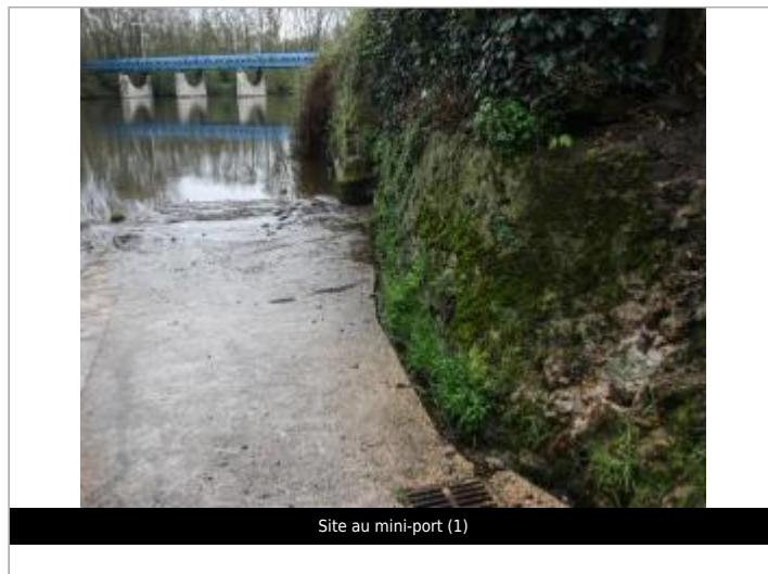
Site au mini-port (1)