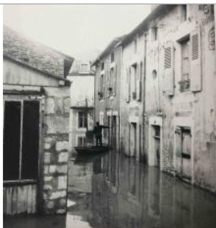
Photographie 1962 - rue des Châteliers / Auteur : P. Sailhan

Organisme(s) : Etablissement public du bassin de la Vienne