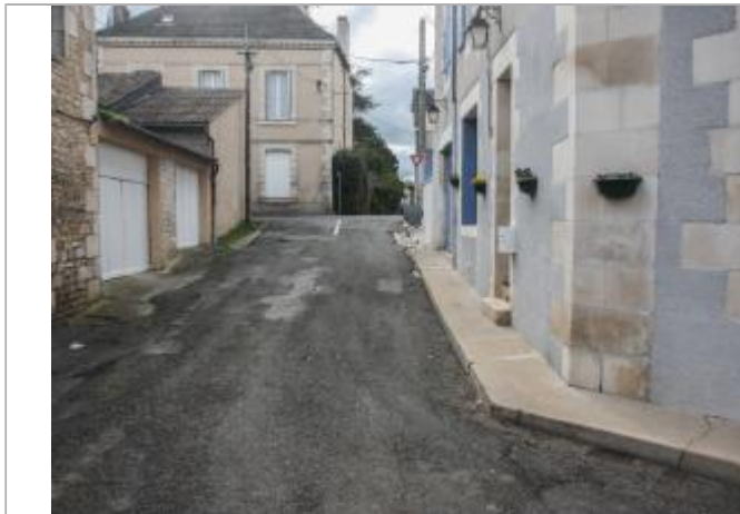
n°1 rue des Châteliers