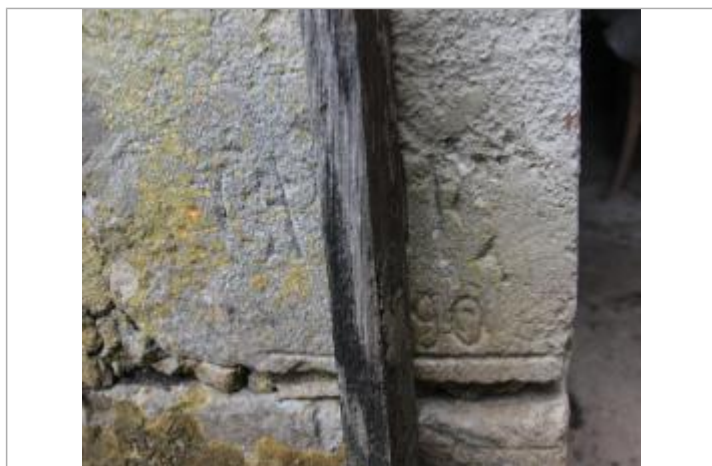
Marque de 1890

SOURCE DE REPÉRAGE : RECENSEMENT DES REPÈRES DE CRUES PAR L'EPTB VIENNE - PHASE OPÉRATIONNELLE DU PAPI VIENNE AVAL - 09/04/2018