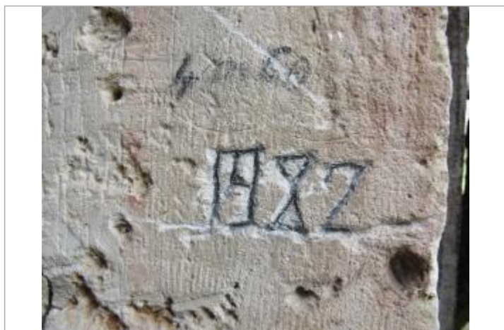
Marque 1982 (janvier)

Texte : 1982 4m60 Maximum de l'inondation : Non renseigné Visibilité : Non État du repère : Moyen Pérennité : Longue Repère calculé : Non PHEC : Non