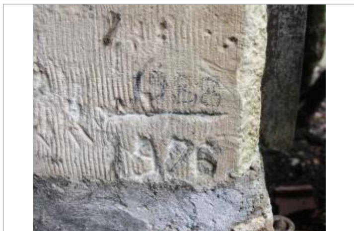
Marques 1976 et 1988

Texte : 1976 Visibilité : Non État du repère : Moyen Pérennité : Longue Repère calculé : Non PHEC : Non