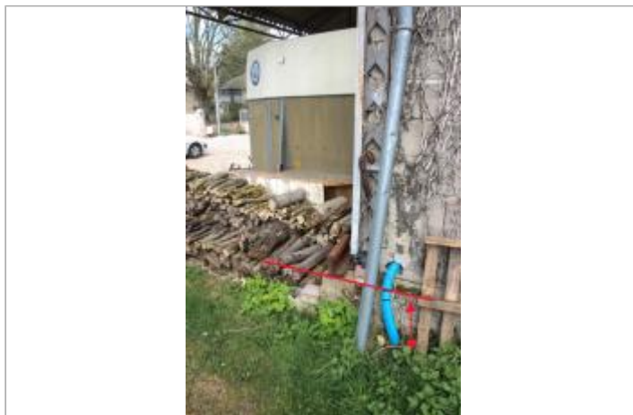
Annexe La Maison Neuve