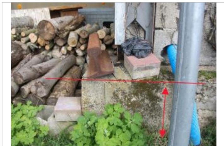
Témoignage - La Maison Neuve (1)

Organisme : Etablissement public du bassin de la Vienne