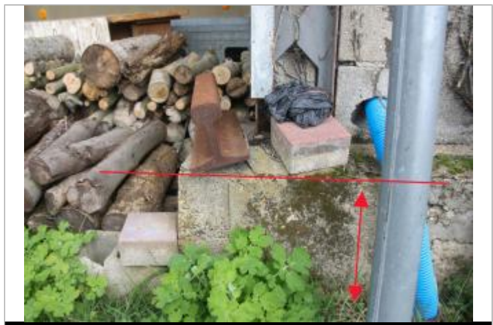
Témoignage - La Maison Neuve (1)

MARQUE Maximum de l'inondation : Non renseigné Visibilité : Non État du repère : Disparu PHEC : Oui Repère calculé : Non