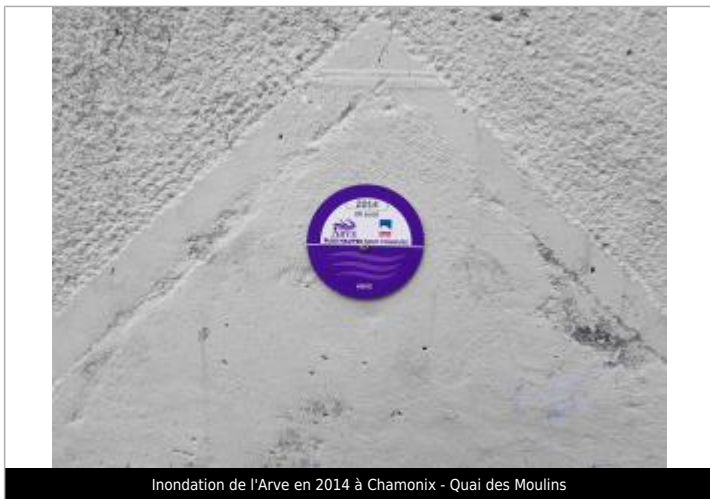
Inondation de l'Arve en 2014 à Chamonix - Quai des Moulins

Maximum de l'inondation : Oui Visibilité : Oui État du repère : Bon Pérennité : Longue