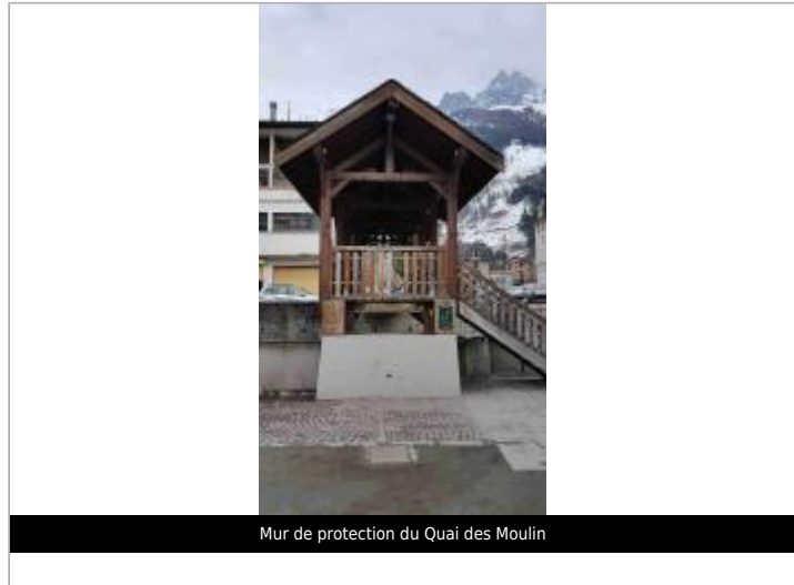
Mur de protection du Quai des Moulin