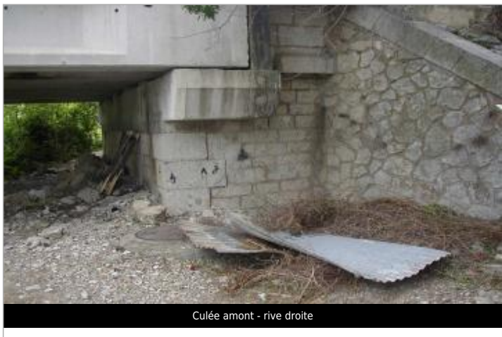
Culée amont - rive droite