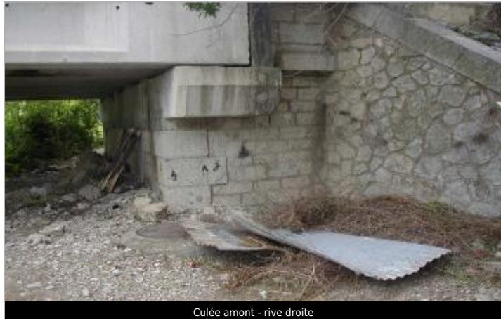
Culée amont - rive droite