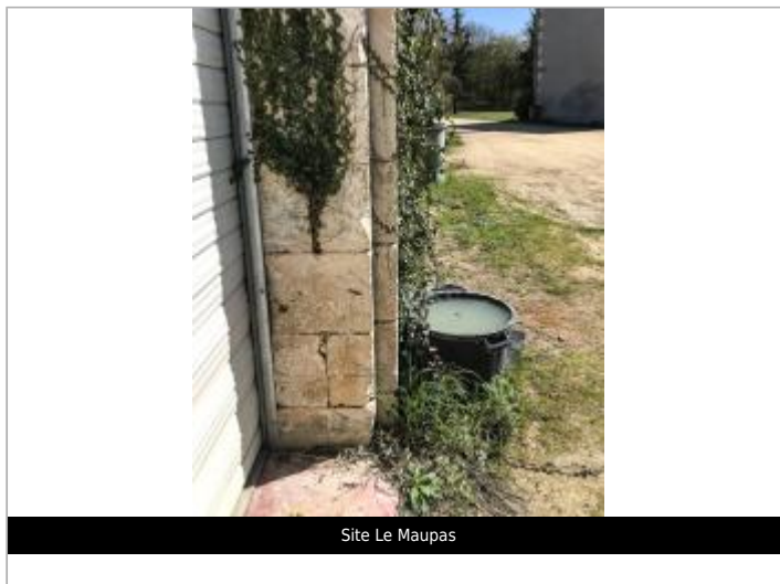
Site Le Maupas