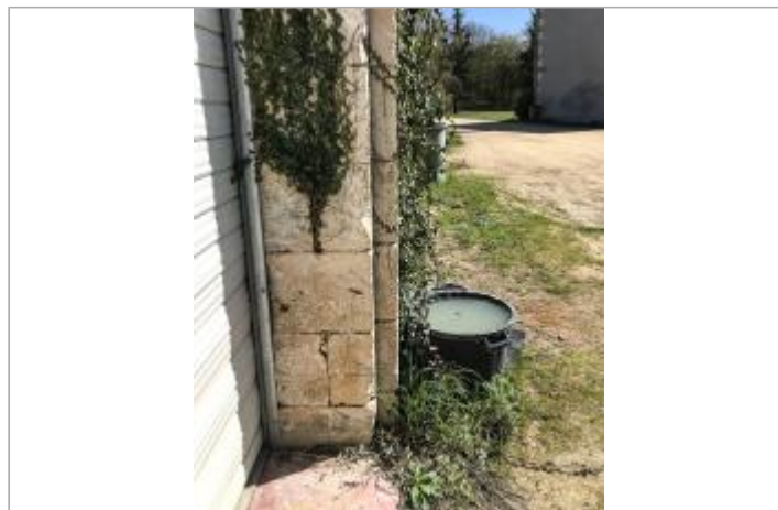
Site Le Maupas