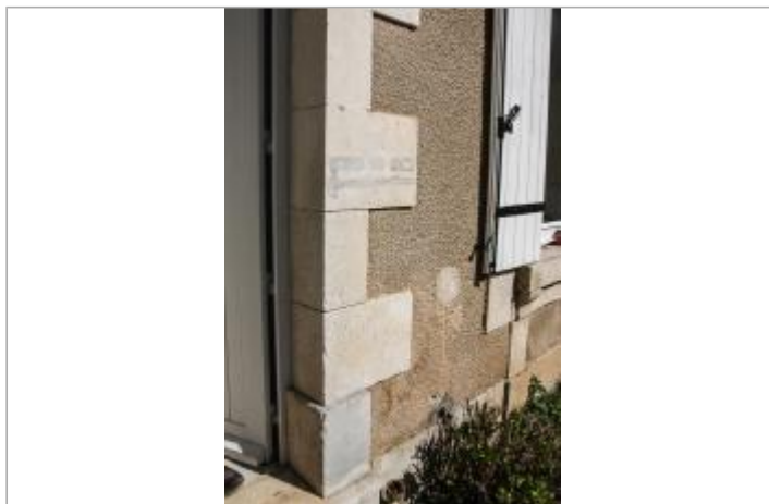
Site 36 rue du Moulin Milon