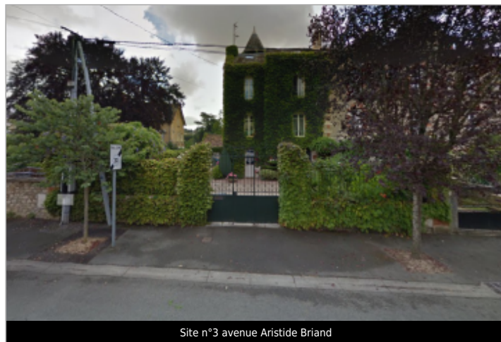
Site n°3 avenue Aristide Briand