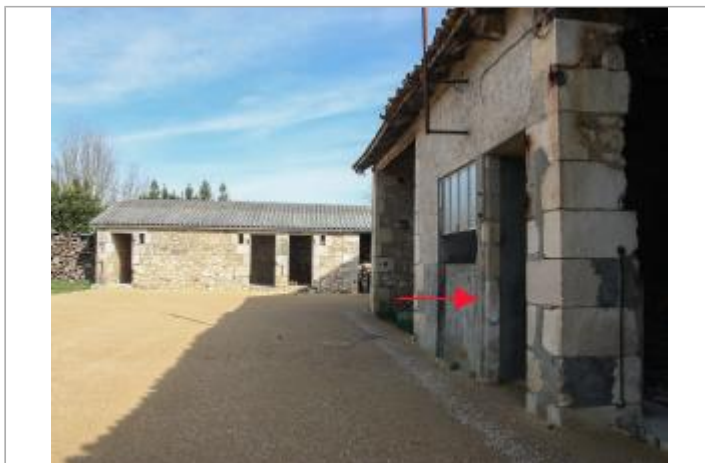
Site rue de la Biguetterie