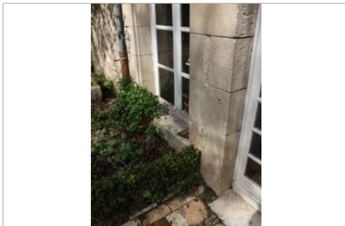
Entrée annexe au n°16 rue de la limousinerie