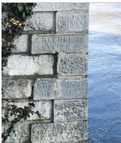
Marques 1879 et 1880