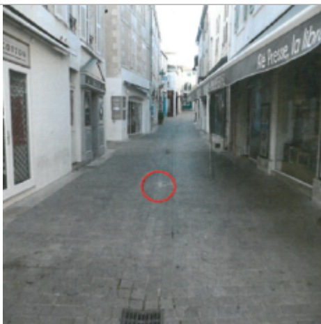
Repère Xynthia - Rue de Sully

Altitude calculée de l'eau (en m) : 4.15 m