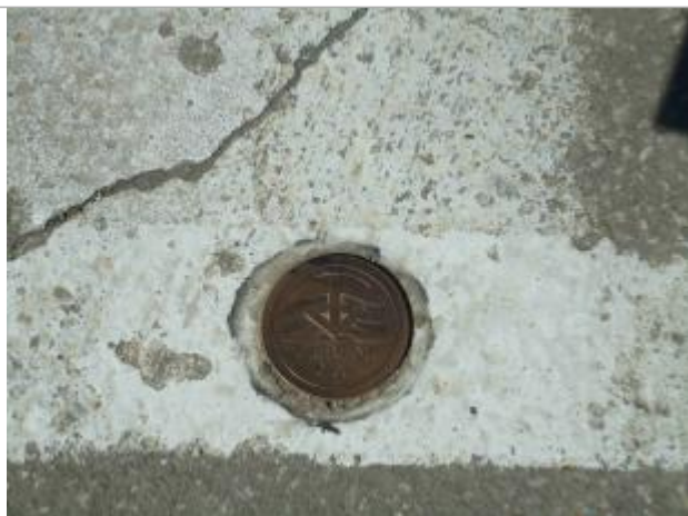
Repère Xynthia - Chemin du Pas des huîtres

Altitude calculée de l'eau (en m) : 7.19