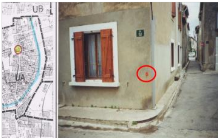
Façade de maison