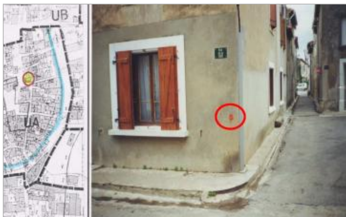
Façade de maison

Altitude calculée de l'eau (en m) : 24.36 m