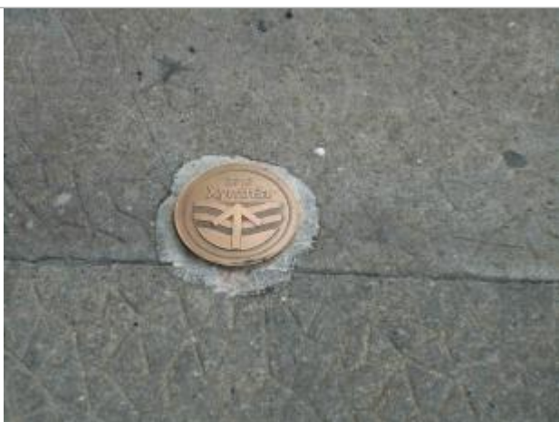
Repère Xynthia - Rue du Baron de Chantal

Méthode : GPS Commentaires sur le nivellement : Nivellement réalisé par un géomètre expert. Référence nivelée : Marque d'inondation Système altimétrique : NGF IGN 1969 (système normal) Altitude de la référence (en m) : 4.310 m Altitude calculée de l'eau (en m) : 4.31 m