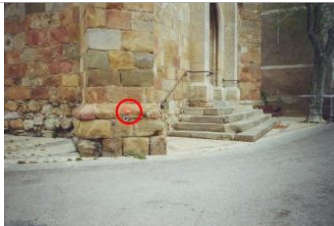
Pilier de l'Eglise