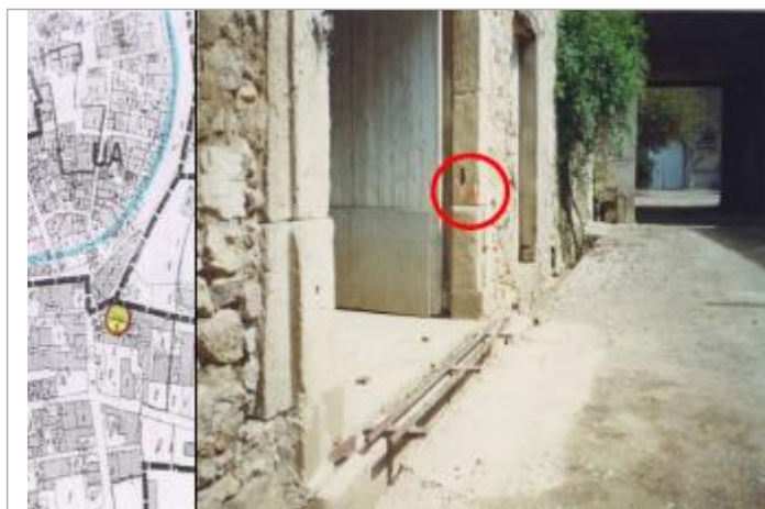
pilier du portail de la cave

Altitude calculée de l'eau (en m) : 24.14 m