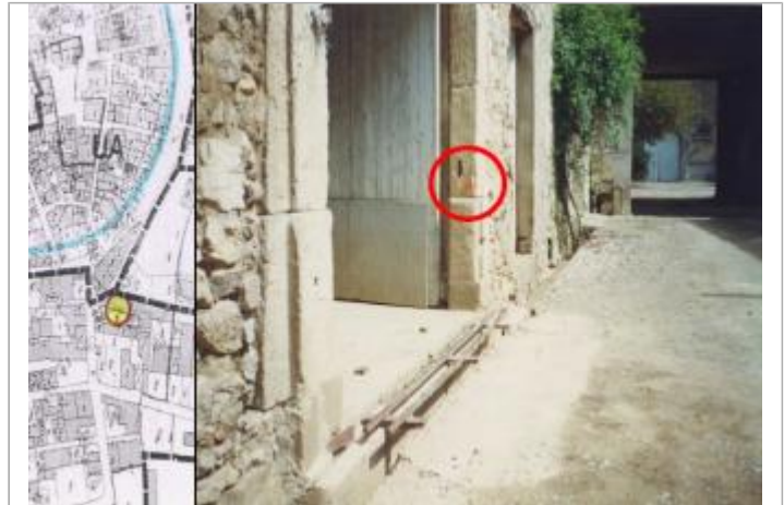
pilier du portail de la cave