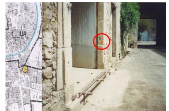
pilier du portail de la cave

Altitude calculée de l'eau (en m) : 24.14