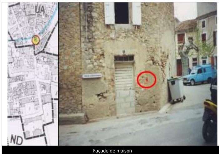
Façade de maison