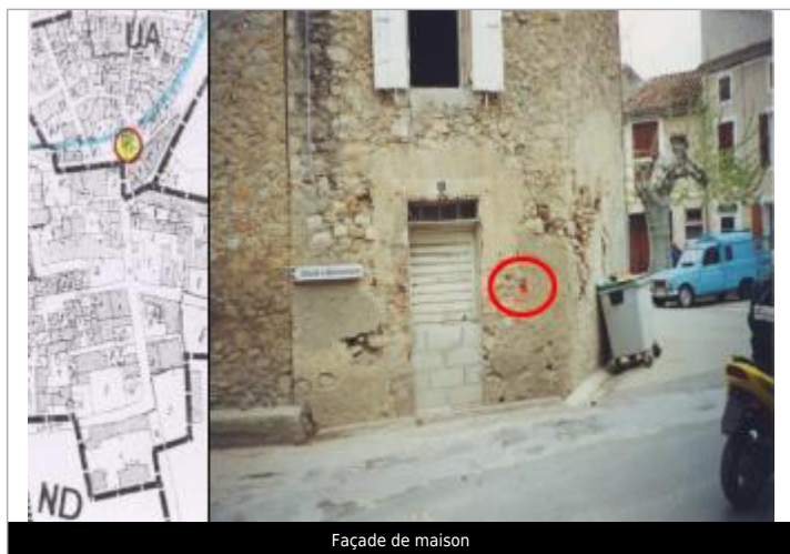
Façade de maison

Altitude calculée de l'eau (en m) : 24.32 m