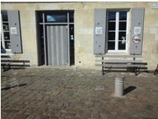
Repère Xynthia - Quai Nicola Baudin

Différence entre le niveau d'eau et la référence (en m) : 4.530 m