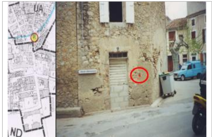
Façade de maison