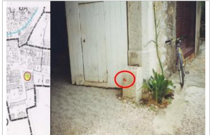
pilier du portail de la cave