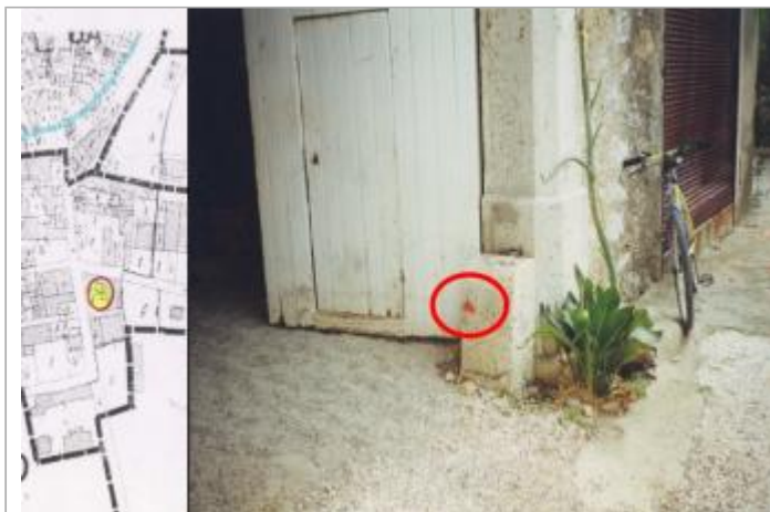
pilier du portail de la cave