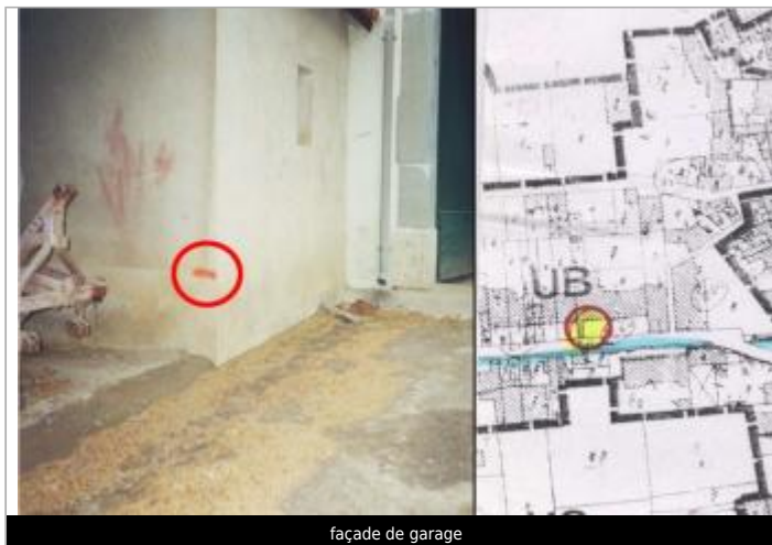
façade de garage