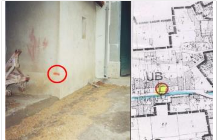
façade de garage