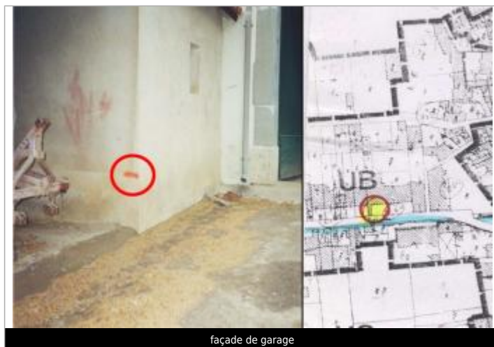
façade de garage

Altitude calculée de l'eau (en m) : 24.18