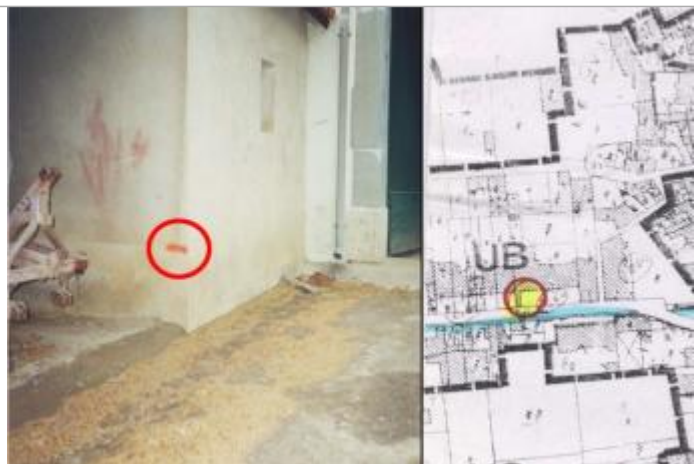
façade de garage

Altitude calculée de l'eau (en m) : 24.18