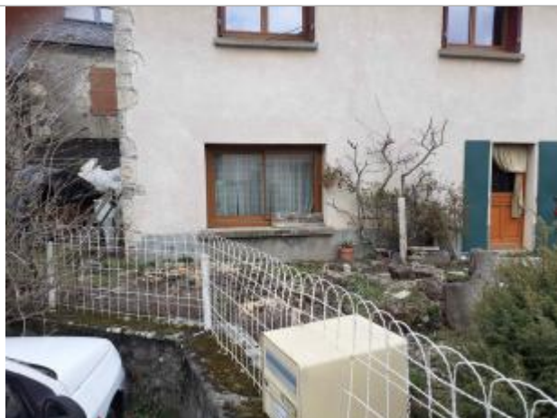
Repère Xynthia - Rue de la Maladrerie

Altitude calculée de l'eau (en m) : 3.74 m