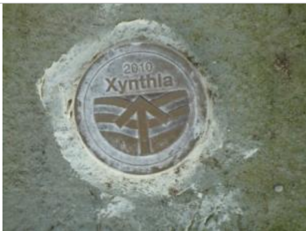
Repère Xynthia - Chemin rural de Saint Sauveur de la Fenandière

Altitude calculée de l'eau (en m) : 6.51