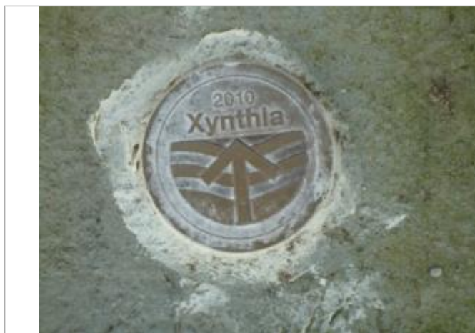
Repère Xynthia - Chemin rural de Saint Sauveur de la Fenandière

Méthode : GPS Commentaires sur le nivellement : Nivellement réalisé par un géomètre expert. Référence nivelée : Marque d'inondation Système altimétrique : NGF IGN 1969 (système normal) Altitude de la référence (en m) : 6.510 m Altitude calculée de l'eau (en m) : 6.51