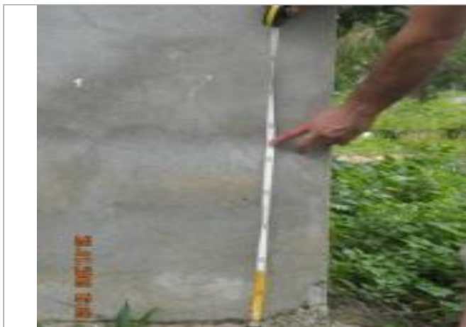
Rue de Montamer