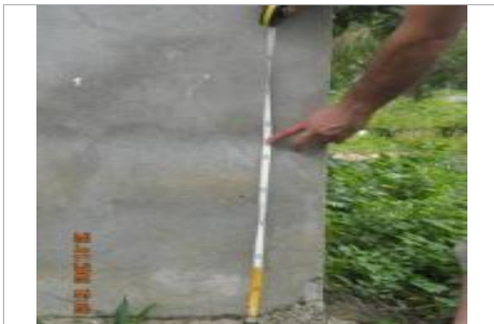
Rue de Montamer