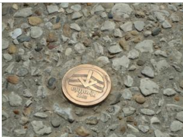
Repère Xynthia-50 rue de Montamer

Méthode : GPS Commentaires sur le nivellement : Nivellement réalisé par un géomètre expert. Référence nivelée : Marque d'inondation Système altimétrique : NGF IGN 1969 (système normal) Altitude de la référence (en m) : 3.170 m Altitude calculée de l'eau (en m) : 3.17 m