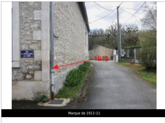
Marque de 1913 (1)