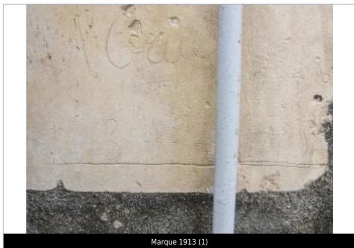
Marque 1913 (1)