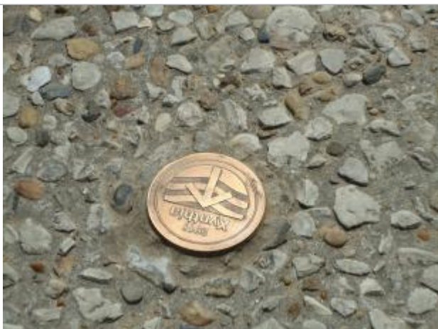
Repère Xynthia-50 rue de Montamer

Méthode : GPS Commentaires sur le nivellement : Nivellement réalisé par un géomètre expert. Référence nivelée : Marque d'inondation Système altimétrique : NGF IGN 1969 (système normal) Altitude de la référence (en m) : 3.170 m Altitude calculée de l'eau (en m) : 3.17