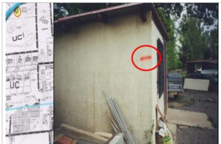
façade abri de jardin

Altitude calculée de l'eau (en m) : 24.4 m