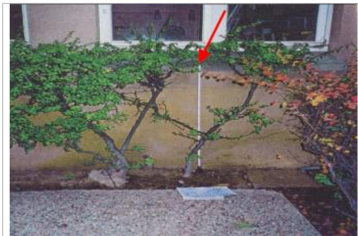
Laisse sur façade derrière la haie