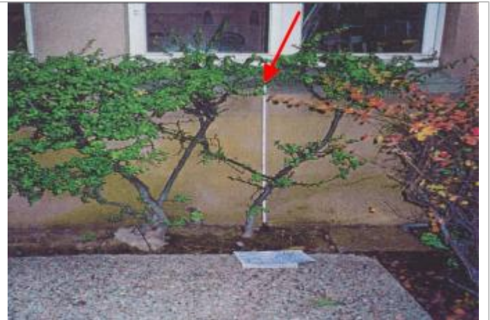
Laisse sur façade derrière la haie