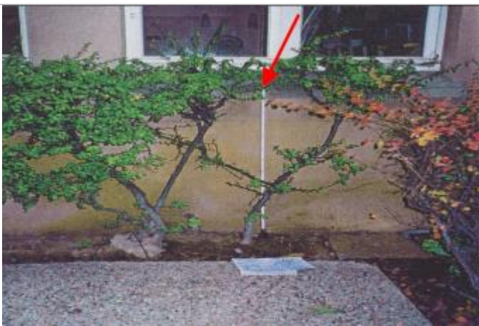
Laisse sur la façade derrière la haie

Altitude calculée de l'eau (en m) : 49.02